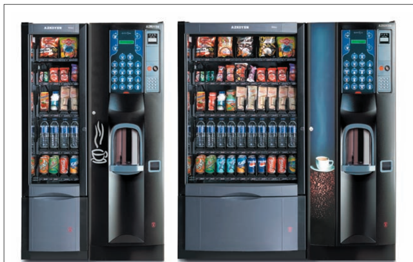
Die vielseitigen Kombinationsmöglichkeiten von Brisa (hier: Brisa 41 mit City MZ, links, und Brisa 85 mit City M, rechts) machen diesen Spiralautomaten zu einem Allround-Wunder. Ein gelungenes Stationskonzept von Azkoyen.

Für den Bereich der Gastronomie bietet das Unternehmen ein komplettes Programm von traditionellen, halb- und vollautomatischen Kaffeeautomaten und hochwertigen Dosiermühlen an. Nach den erfolgreichen Verkäufen in den USA, Kanada, Japan, Korea und Australien startet Azkoyen jetzt mit einem völlig neuen Gerätekonzept auch in den deutschen Markt. Mit dem neuen Modell Xpression kommt man den höchsten Anforderungen an ein modernes Maschinendesign nach. Aber noch mehr interessiert den Kunden die Kaffeequalität in der Tasse. Mit der jahrelangen Erfahrung und der eigenen Fertigung sämtlicher Komponenten, von der Espressoereinheit bis zur Elektronik, garantiert man bei jeder Tasse Espresso das perfekte Gleichgewicht zwischen Fülle, Crema, Aroma und Geschmack - von der ersten bis zur letzten Tasse.