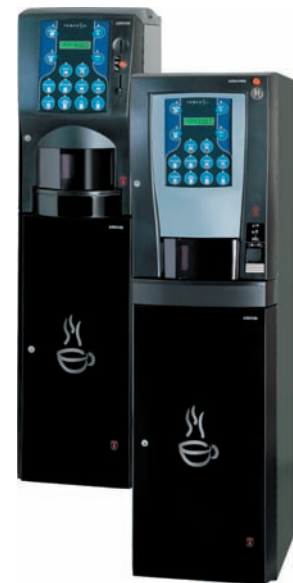
Tempo M und L - die beiden Stars im OCS und HoReCa. Gleich ob als Instant- oder Espresso-Version, Tempo bietet immer das richtige Getränk.

Für die Gastronomie stellt Azkoyen professionelle Geräte her, mit denen man überall in der Lage ist, Kaffeespezialitäten in bester Qualität anzubieten. Im Bereich der Zahlungssysteme gehörte Azkoyen bereits von Anfang an zu den entscheidenden Ideengebern und Entwicklern neuester Technologien für verschiedene Einsatzbereiche (Vending-, Tabak- und Spielautomaten, Münzfernsprecher etc.). Durch die Übernahme der Firma COGES bietet Azkoyen heute zusätzlich auch Geldscheinleser und berührungslose Zahlungssysteme an. Der Bereich der Verkaufsautomaten umfasst eine breite Produktpalette für den automatischen Verkauf von Heiß- und Kaltgetränken, von Snacks und Tabakwaren. "Wir verfolgen