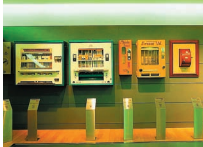
Historische Automaten im Firmenmuseum.

und Espresso und steht in zwei verschiedenen Größen zur Verfügung - Tempo M und Tempo L. Beide Geräte eignen sich hervorragend für kleinere und mittlere Stellplätze, an denen gerne und viele verschiedene Heißgetränkesspezialitäten konsumiert werden. Dank der Espresso-Version können auch anspruchsvollste Konsumenten zufrieden gestellt werden.