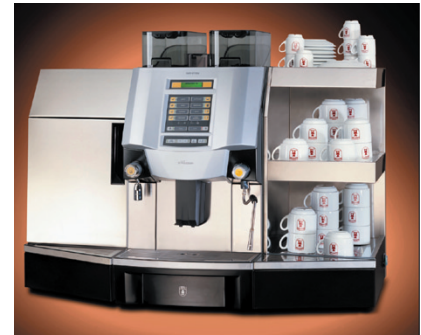
Xpression - ein rundum gelungener Vollautomat für verschiedene Einsatzbereiche. Hier mit Anbaumodulen Milchkühler (mit einer Aufnahmekapazität von bis zu 4 Litern) und Tassenwärmer für bis zu 50 Tassen.

Der Snack- und Kaltgetränke-Automat Brisa ist der neue leistungsfähige Star am Azkoyen-Himmel. Drei verschiedene Größen des Automaten mit und ohne Aufzug sind erhältlich, die sich alle